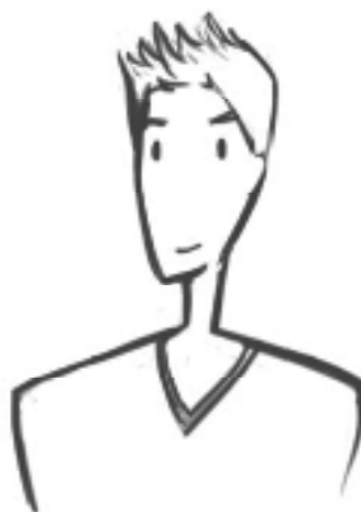
朴大中 Daewoo-Jung Piáo Dàzhōng